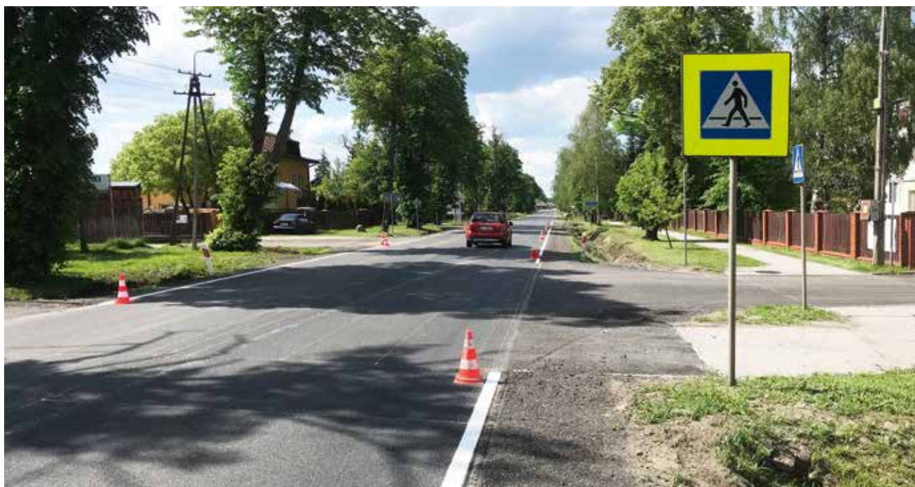
Droga krajowa nr 62 w Łochowie – wykonanie oznakowania poziomego