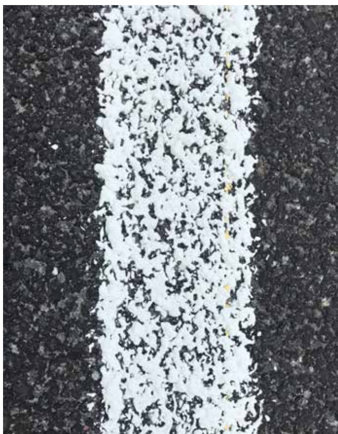
Widok oznakowania poziomego po renowacji