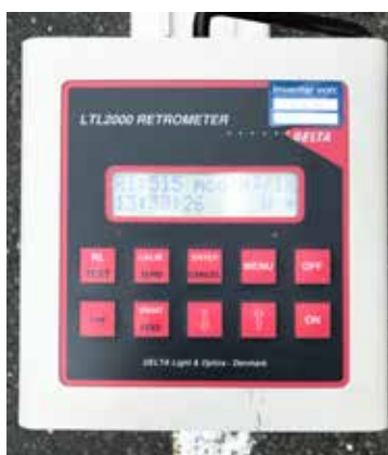
Reflektometr Delta LTL 2000 do badania współczynnika odblasku; wynik odblasku RL = 515 mcd/m 2 /lx