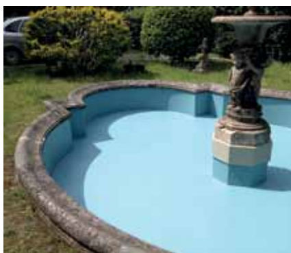
... e sigillata con Triflex Ceryl Finish in tonalità 205 (Aqua).