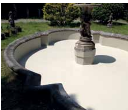
L'intera superficie è stata impermeabilizzata con Triflex ProTect ...