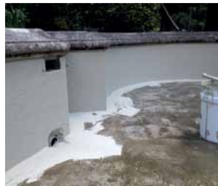
I collegamenti dei dettagli sono stati impermeabilizzati con Triflex ProDetail.