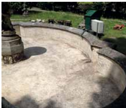
Le superfici in calcestruzzo sono state completamente pulite e levigate.