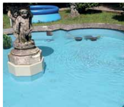
Ora, la fontana splende nuovamente di un fresco blu turchese.