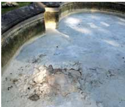
Il vecchio sottofondo della fontana si sfaldava ampiamente.