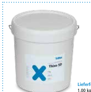
Lieferform 1,00 kg Triflex Thixo SD

Triflex Stone Design S – auch chargenreine Lieferungen – miteinander vermischen (siehe Punkt 5 „Verarbeitungsanleitung Fläche“).