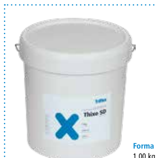
Forma di fornitura 1,00 kg Triflex Thixo SD

Mescolare tra loro le quantità Triflex Stone Design S (anche forniture a partita omogenea) (vedere articolo 5 „Istruzioni di lavorazione superficie“).